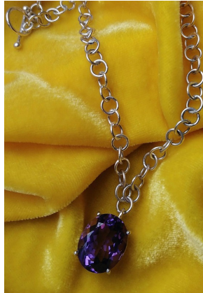
Argent 925, améthyste 11 cts