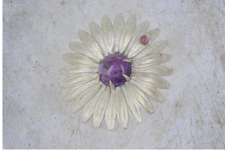
Argent 925, améthyste et tourmaline rose