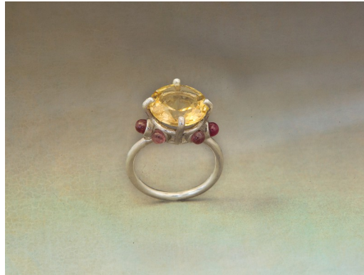
Argent 925, citrine et tourmalines rouges et roses